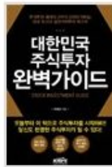
대한민국 주식투자 완벽가이드

※ 현재까지 총 10종, 반영구적 가치투자지혜/지식 주제 및 크고 긴 효용의 투자분석 주제로 출간되었습니다.