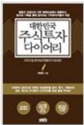
대한민국 주식투자 다이어리