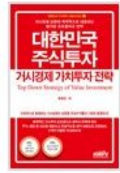
대한민국 주식투자 거시경제 가치투자 전략