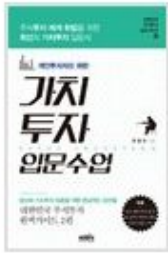
개인투자자를 위한 가치투자 입문수업

※ 최대의 성과를 지속적으로 유지하기 위해, <실전가치투자 공부편, 활용편> 등으로 구분.