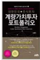
대한민국 주식투자 계량가치투 자 포트폴리오