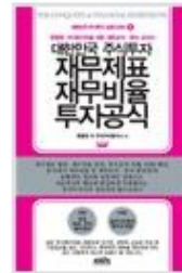
대한민국 주식투자 재무제표, 재무비율, 투자공식