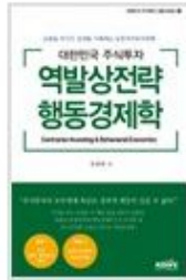
대한민국 주식투자 역발상전략 행동경제학