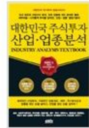
대한민국 주식투자 산업·업종 분석