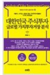
대한민국 주식투자 글로벌 가 치투자거장 분석